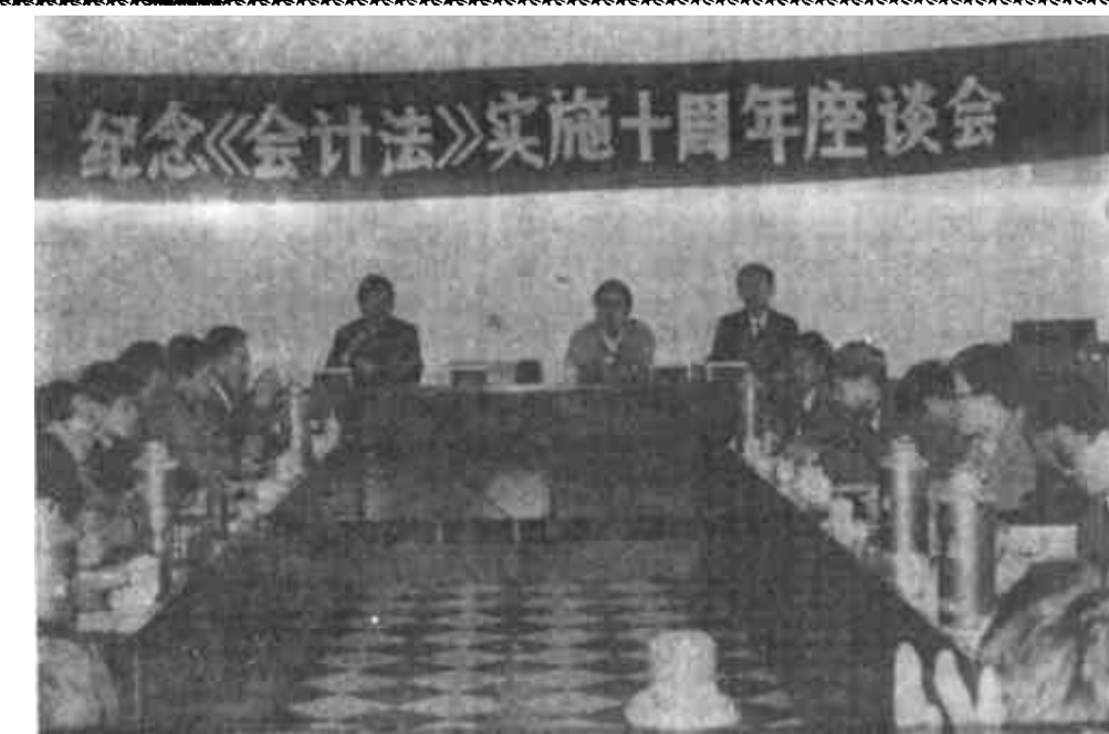
图为座谈会会场。

四、加强会计基础工作，提高会计工作质量。抓好会计基础工作是做好整个会计工作的关键。自1988年以来，按照省财政厅部署，开展了会计工作达标升级活动。我们首先在进行试点的基础上，制定规划，明确目标，工作进度既求数量又求质量。同时，制定配套的制约措施，将会计达标升级工作同企业升级、企业承包合同兑现、会计人员评聘专业技术职务、会计人员的表彰奖